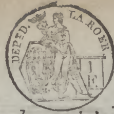
TABLE ALPHABÉTIQUE des Actes de mariages de la mairie de Weychen pour l'an 1813 dressée en exécution du décret impérial du 20 juillet 1807.