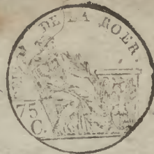
TABLE ALPHABÉTIQUE des Actes des décès de la mairie de Klein-Kempen pour l'an 1811 dressée en exécution du décret impérial du 20 juillet 1807.