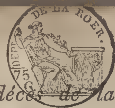
TABLE ALPHABÉTIQUE des Actes de décès de la mairie de Willich pour l'an 1812 dressé en exécution du décret im- périeur du 20 juillet 1807.