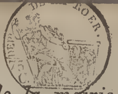
TABLE ALPHABÉTIQUE des Actes de décès de la mairie d pour l'an dressée en exécution du décret impérial du 20 juillet 1807.